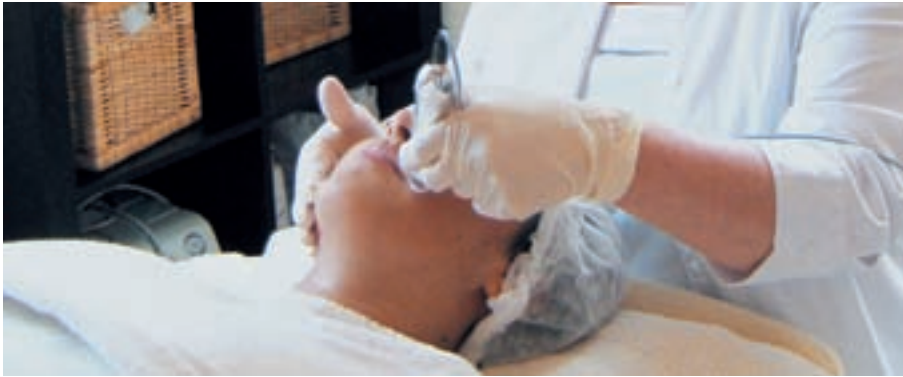
Die Haut wird mit speziellen Behandlungen und typgerechter Heimpflege optimal auf den Eingriff vorbereitet

Kundin schnell vergisst, wie sie vor dem Eingriff aussah. So lässt sich immer vergleichen, welche Verbesserung durch den Eingriff stattgefunden hat. In der Kundenkarteikarte sowie in einem separaten Unterspritzungs-Pass, den die Kundin erhält, werden verwendete Produktmenge, Wirkstoff und unterspritzte Gesichtspartien schriftlich festgehalten.